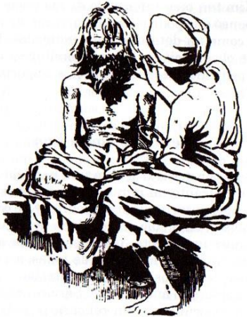
Kim caracterizando al espía.

apropiadas; le cubrió las heridas con harina y ceniza para que fueran menos visibles. Le despeinó el cabello para darle el aspecto sucio de un mendigo y le cubrió de polvo. Su propia madre no le hubiera reconocido.